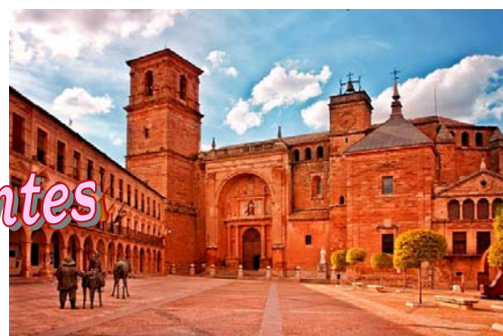
Conjunto Histórico Artístico