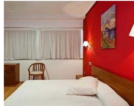
Hotel Ciudad de Corella, Corella