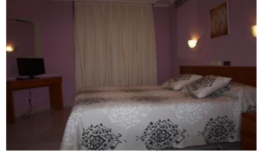
Hotel María de Molina (***) Toro