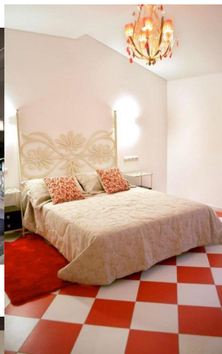
Hostal Mesón Castilla ** Sigüenza